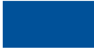
Miloriblau hell 25